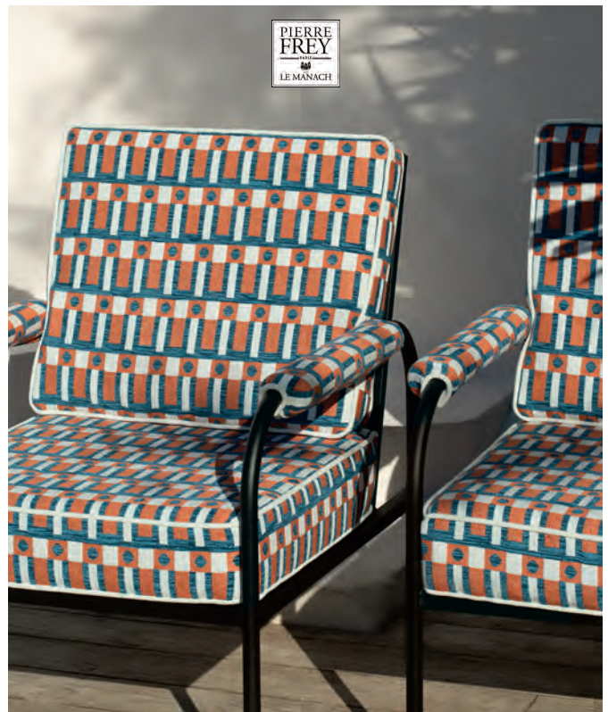
▲ KUBIC OUTDOOR (キュービック) 全2色 ¥76,650/m 生地巾137cm

アーカイブをアレンジしたこのジャカード織は、ストライプとチェックの間に幾何学模様を描き、モダニズムの雰囲気表現しています。