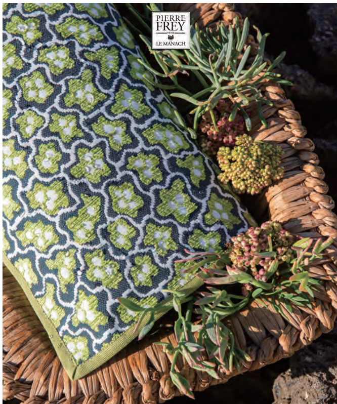
▲ NYMPHEAS OUTDOOR (ニンフェア) 全3色 ¥75,350/m 生地巾136cm

水中世界の有機的な美しさを想起させるこのデザインは、18世紀のドゥルゲ織*を再解釈したような趣きがあります。