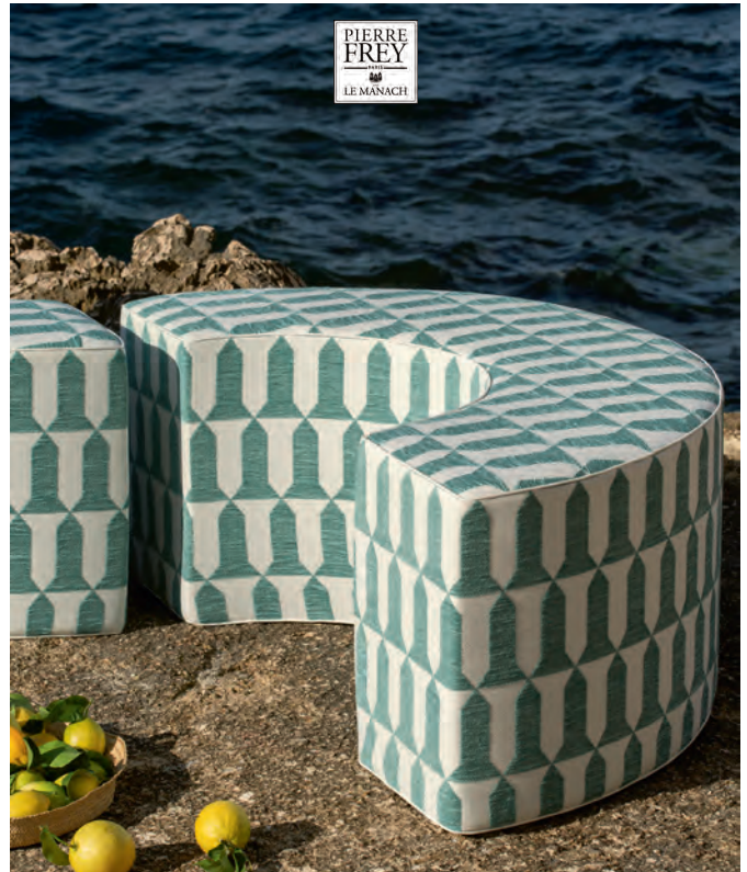
▲ BLASON OUTDOOR (ブラゾン) 全2色 ¥61,930/m 生地巾137cm

中世にあった紋章を現代的に再解釈し、タイムレスなイメージに仕上げています。ルマナックを象徴するデザインのひとつです。